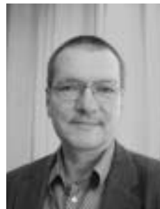
Vorsitzender des Förderkreises der Peter-Josef-Briefs-Schule für Körperbehinderte im Antoniushaus Hochheim e.V.